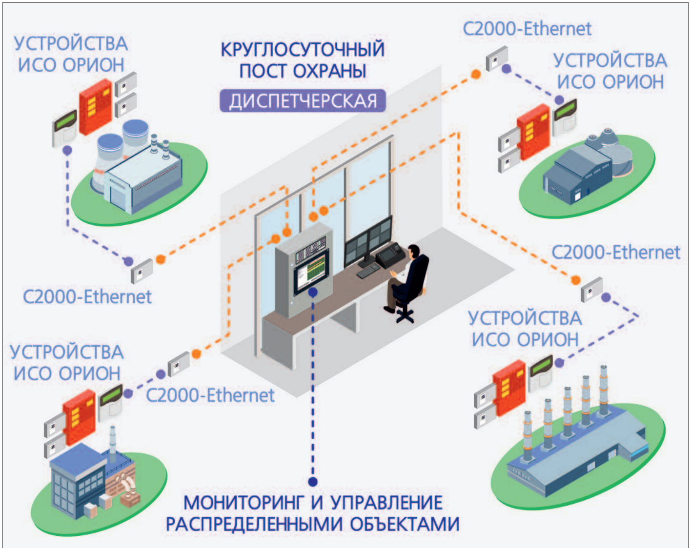
Рис. 2. Круглосуточный пожарный пост для систем пожарной автоматики территориально распределенных объектов

ный экран ЦПИУ "Орион". Пользовательский интерфейс специально оптимизирован под возможности цветных сенсорных экранов, что позволяет отображать в удобном виде полученные данные от пультов "С2000М". Дублируют информацию единичные светодиодные индикаторы, что соответствует требованиям ГОСТ Р 53325–2012. До появления ЦПИУ "Орион" для удовлетворения вышеуказанных нормативных требований все пульты "С2000М" или блоки индикации типа "С2000-БКИ" размещались в одном помещении, на самом посту. Все оборудование систем пожарной автоматики соединялось по проводным линиям связи интерфейса RS-485, которые прокладывались между постом и удаленными зданиями (сооружениями) объекта. Но при необходимости размещения пультов "С2000М" в удаленном здании для подключения блоков индикации к посту требовалось проложить дополнительные линии связи. Теперь появился другой вариант решения, при котором информационный обмен между пультами "С2000М" и ЦПИУ "Орион" может вестись по общей локальной сети, в которую "С2000М" подключаются посредством преобразователей интерфейса C2000-Ethernet. Безусловно, локальная сеть для противопожарных систем должна строиться